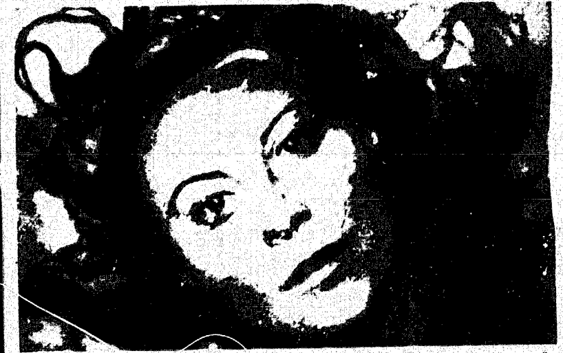
C'est le détachement... Gertrude a provoqué un drame de famille sans issue. Victime de la passion du pasteur, elle quitte sa maison. Le pasteur retrouvera Gertrude morte dans les neiges.

Notre est étonnante dans le rôle du grand de la femme du pasteur, Jeanne, Pierre Blanchard, chargé de l'éducation de Gertrude, pour un usage d'une technique aux méthodes nouvelles. Les scènes de Jean Desailly fait valoir, Michèle Morgan, l'éducation de la jeune aveugle par le pasteur devant une scène, la rencontre de Jacques et Gertrude après l'opération, la mort de Gertrude, de Michèle Morgan dans les neiges, et de la scène de la mort, sont peut-être les plus belles images de ce film qui est retenu à Paris son succès de succès et apportera à André Gide de nouveaux et nombreux lecteurs. Tant mieux pour le cinéma !